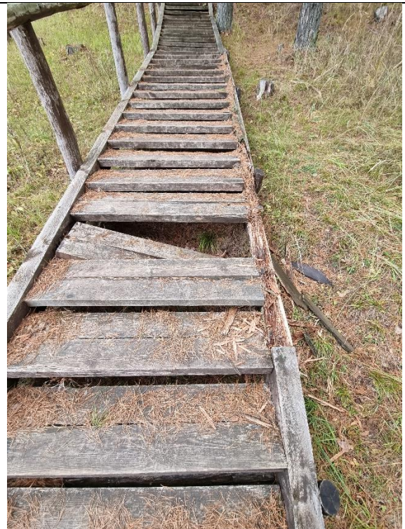
Unikalus kodas Kultūros vertybių registre – 16297