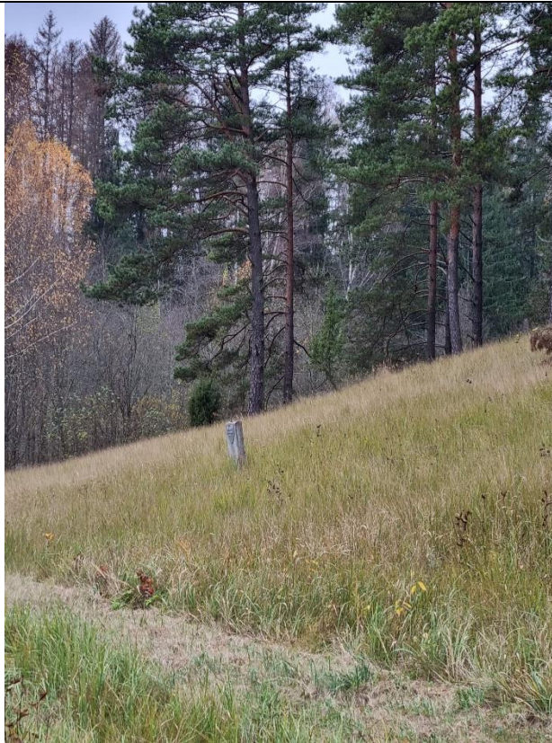
Unikalus kodas Kultūros vertybių registre – 16297