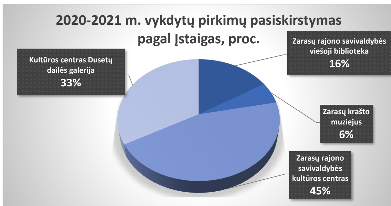
1 pav. 2020-2021 m. vykdytų pirkimų pasiskirstymas pagal įstaigas, proc.

Šaltinis – Kontrolės ir audito tarnyba pagal įstaigų pateiktus duomenis