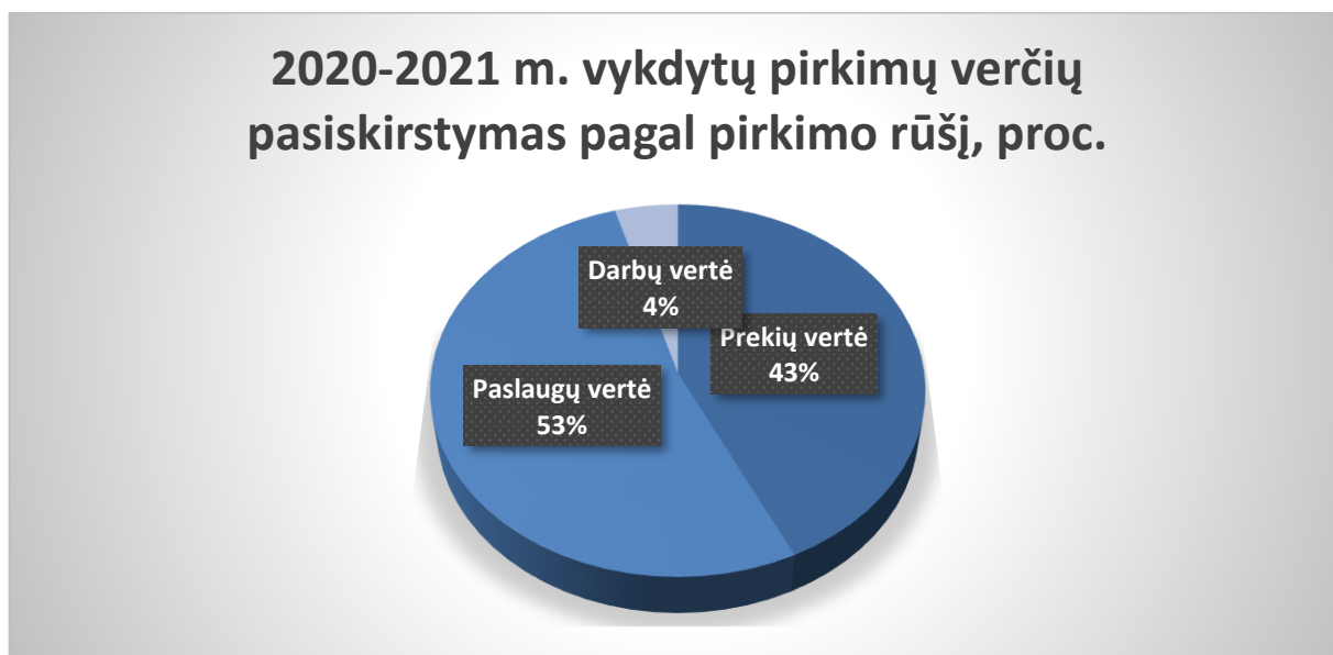
3 pav. 2020-2021 m. vykdytų pirkimų verčių pasiskirstymas pagal pirkimo rūšį, proc.

Šaltinis – Kontrolės ir audito tarnyba pagal Įstaigų pateiktus duomenis