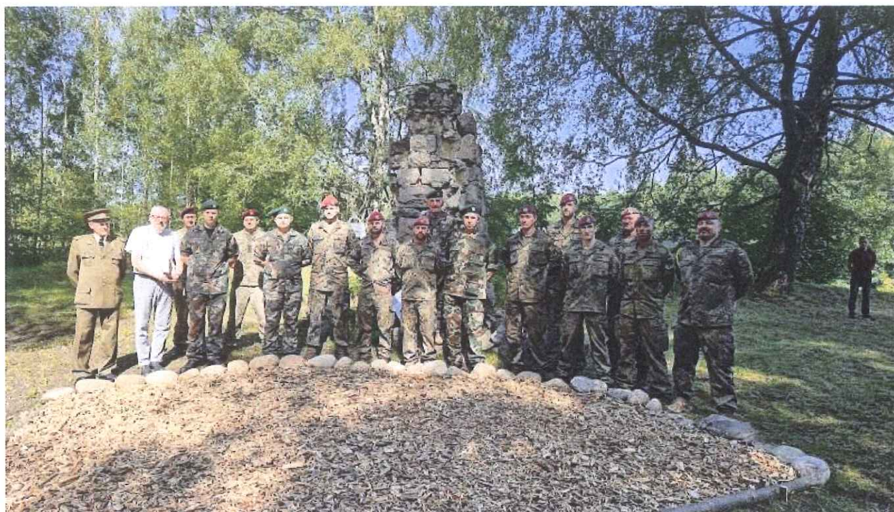
Pav., Pirmojo pasaulinio karo vokiečių karių kapų tvarkymo darbų užbaigimo minėjimas Suvieko kaime, Suvieko seniūnijoje, Zarasų rajone