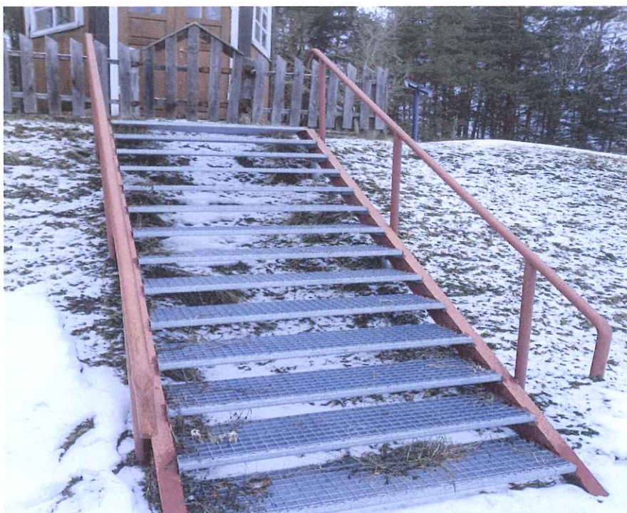
Pav. Salako koplytėlės (unikalus kodas Kultūros vertybių registre 14689) laiptai

2023 metais įrengti laiptai į Salako koplytėlę su ornamentuotu kryželiu, Nukryžiuotojo ir Rūpintojėlio skulptūromis (unikalus kodas Kultūros vertybių registre 14689):