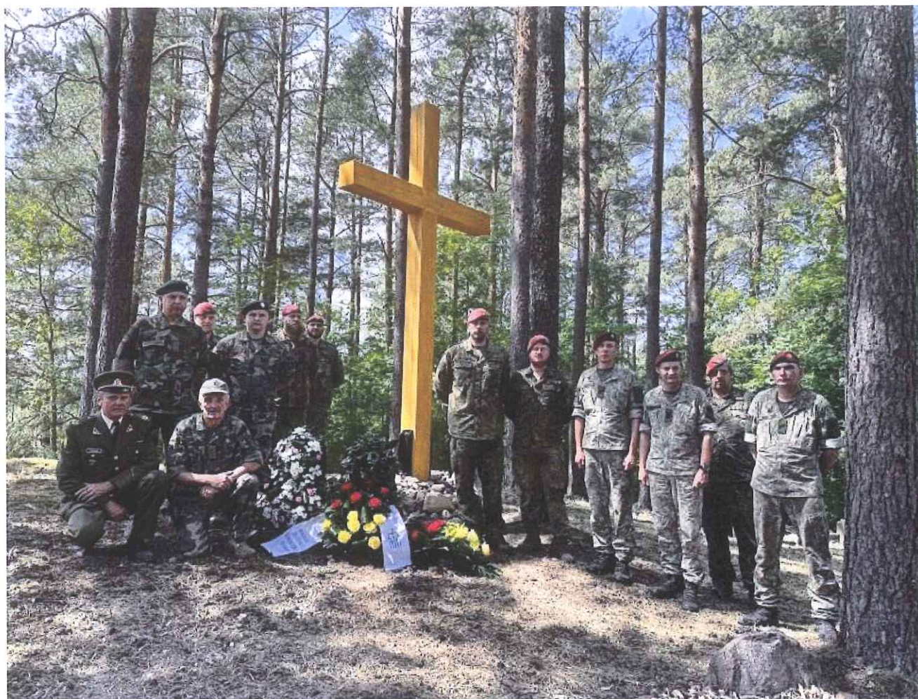
Pav., Pirmojo pasaulinio karo vokiečių karių kapų tvarkymo darbų užbaigimo minėjimas Gružtų kaime, Zarasų seniūnijoje, Zarasų rajone